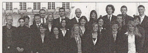
La promotion 2008-2009

Le Master 2 Droit de l'entreprise et des affaires-Diplôme de juriste conseil d'entreprise (DJCE) de Nancy vient de fêter ses 30 ans. Depuis 1978, plus de 600 étudiants ont suivi cette formation de niveau bac +5, et la plupart sont devenus avocats d'affaires ou juristes d'entreprises. Au cours des cinq dernières années, le DJCE de Nancy a obtenu trois fois le premier prix du concours Ernst & Young récompensant le meilleur jeune fiscaliste de France, deux fois le premier prix du concours Landwell récompensant la meilleure équipe de juristes d'affaires, deux fois le prix décerné par la DVNI du ministère des Finances récompensant le meilleur jeune fiscaliste, une fois le prix décerné par la Cour administrative d'appel de Paris, et une fois le premier prix du concours Freshfields récompensant le meilleur jeune juriste d'affaires.